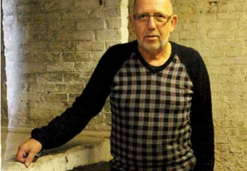
De winkelders van het Koninklijk Paleis bevonden zich vroeger onder het huidige Grondwettelijk Hof. De doorgang naar het paleis is nu wel dichtgemetseld.