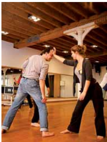
© Mbargo Bijt in Brussel, 2009