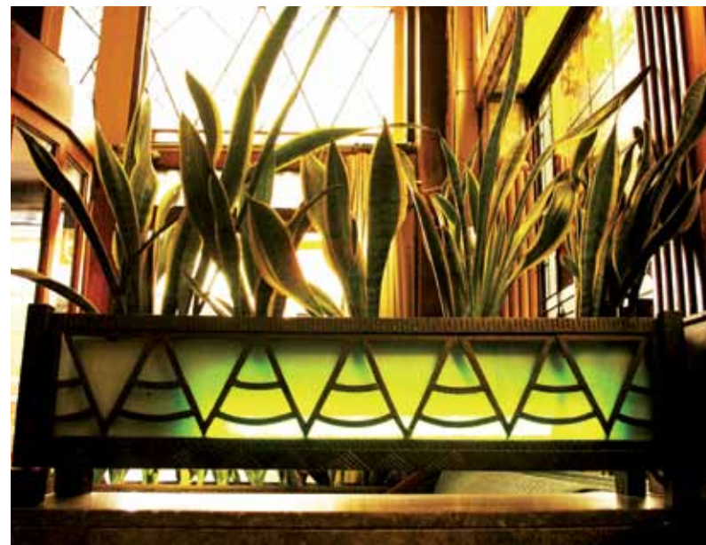
Sanseverias, perfect geïntegreerd in het beschermde interieur van café L'Espérance

De meeste mensen hebben niet zulke intieme betrekkingen met hun planten als met hun huisdieren. Een kat is aaibaar, een hond gezellig, zeker als je alleen bent. Dat kun je niet van een vlijtig Liesje zeggen, ik heb het nog steeds over planten. Maar toch worden ook aan planten allerlei menselijke eigenschappen toebedacht. Elsschot, toch een schrijver die ook in Brussel heeft gewoond, laten ze het niet in Antwerpen horen, ze krijgen een fit, schreef over het nederige gras. Proust had het over la force tranquille du camelia, een opmerking die de man die de verkiezingscampagne van president Mitterand indertijd bedacht handig gebruikte. Overal in Frankrijk hingen levensgrote pos-