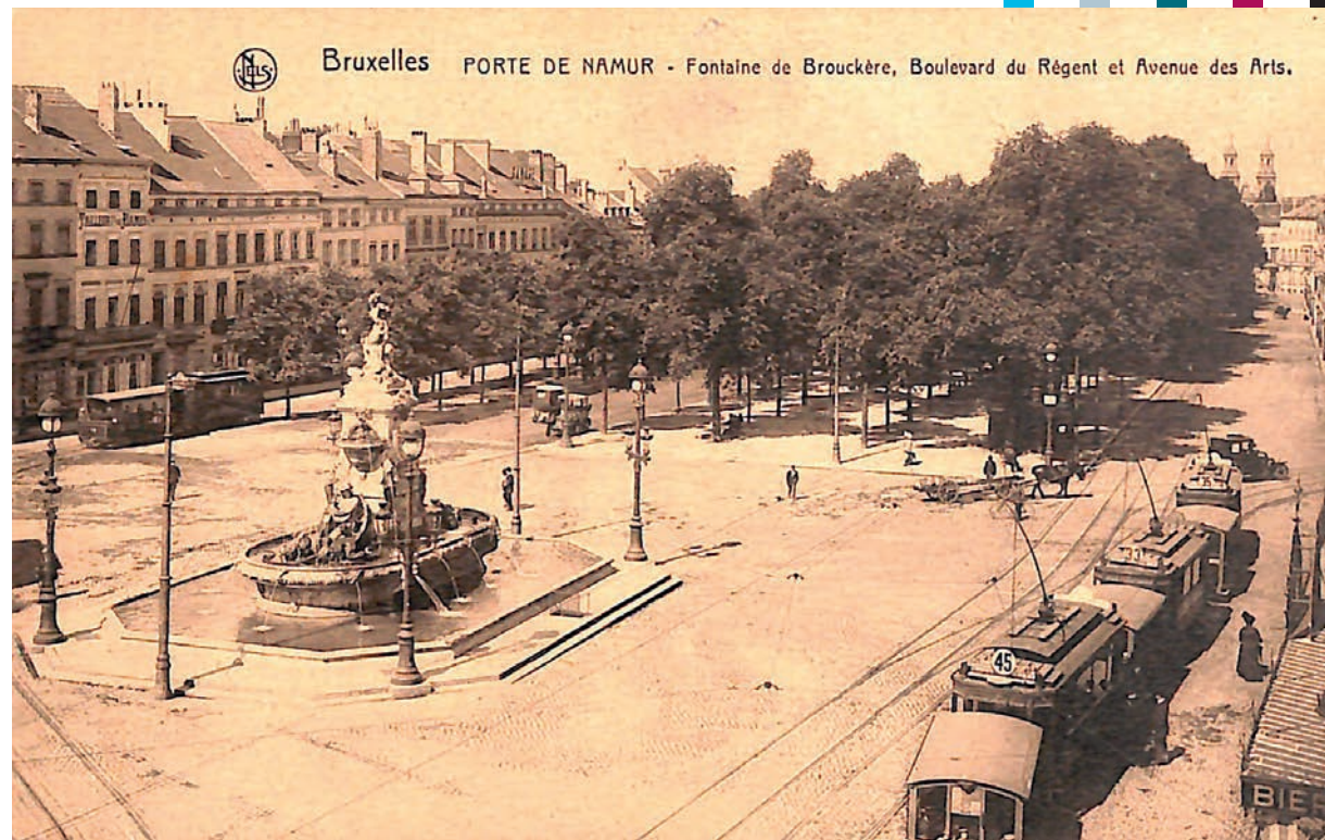
BRUXELLES BRUXELLES PORTE DE NAMUR FONTAINE DE-BROUCKERE BOULEVARD DU REGENT ET AVENUE DES ARTS

De fontein ter ere van de liberale burgervader zou pas in de jaren vijftig van de twintigste eeuw moeten plaats ruimen voor de tunnels van de Kleine Ring. Zoals dat vaak gebeurt met monumenten in Brussel had het veel voeten in de aarde voor de inhuldiging een feit was. Al in het jaar van het overlijden van de burgemeester werd een openbare inschrijving georganiseerd voor de oprichting van een monument. Aanvankelijk werd gedacht aan een plein in de Leopoldswijk maar (ongegronde) geruchten dat daar een Londens monument zou komen, gooiden roet in het eten. Na een hele rits projecten die het niet haalden, werd gekozen voor een idee van architect Beyaert, in samenwerking met beeldhouwers Edouard Fiers en Pierre Dunion. Bovendien liep