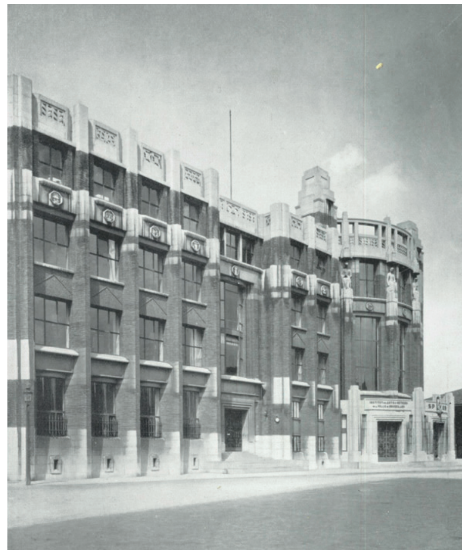
ARTS ET MÉTIERS

In september 1932 volgen niet minder dan 5000 studenten, vooral 's avonds de opleidingen die men in de 'Arts et Métiers' kan volgen in de 24 auditoria en talloze ateliers: goudsmid, juweelmaker, émailleur, lederbewerker, kapper, schoenmaker, pelsbewerker,