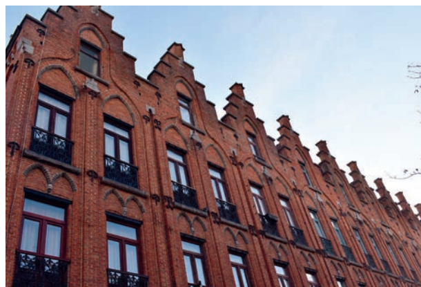
BESCHERMDE ARBEIDSWONINGEN IN DE KRUITMOLENSTRAAT

Het geheel wordt een woonerf, zonder niveaoverschillen, waardoor wel een aantal parkeerplaatsen verdwijnen.