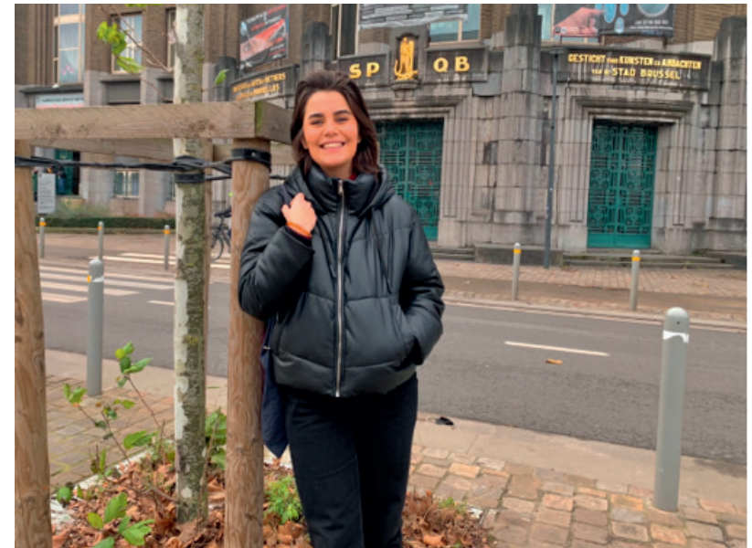
Arts et Métiers