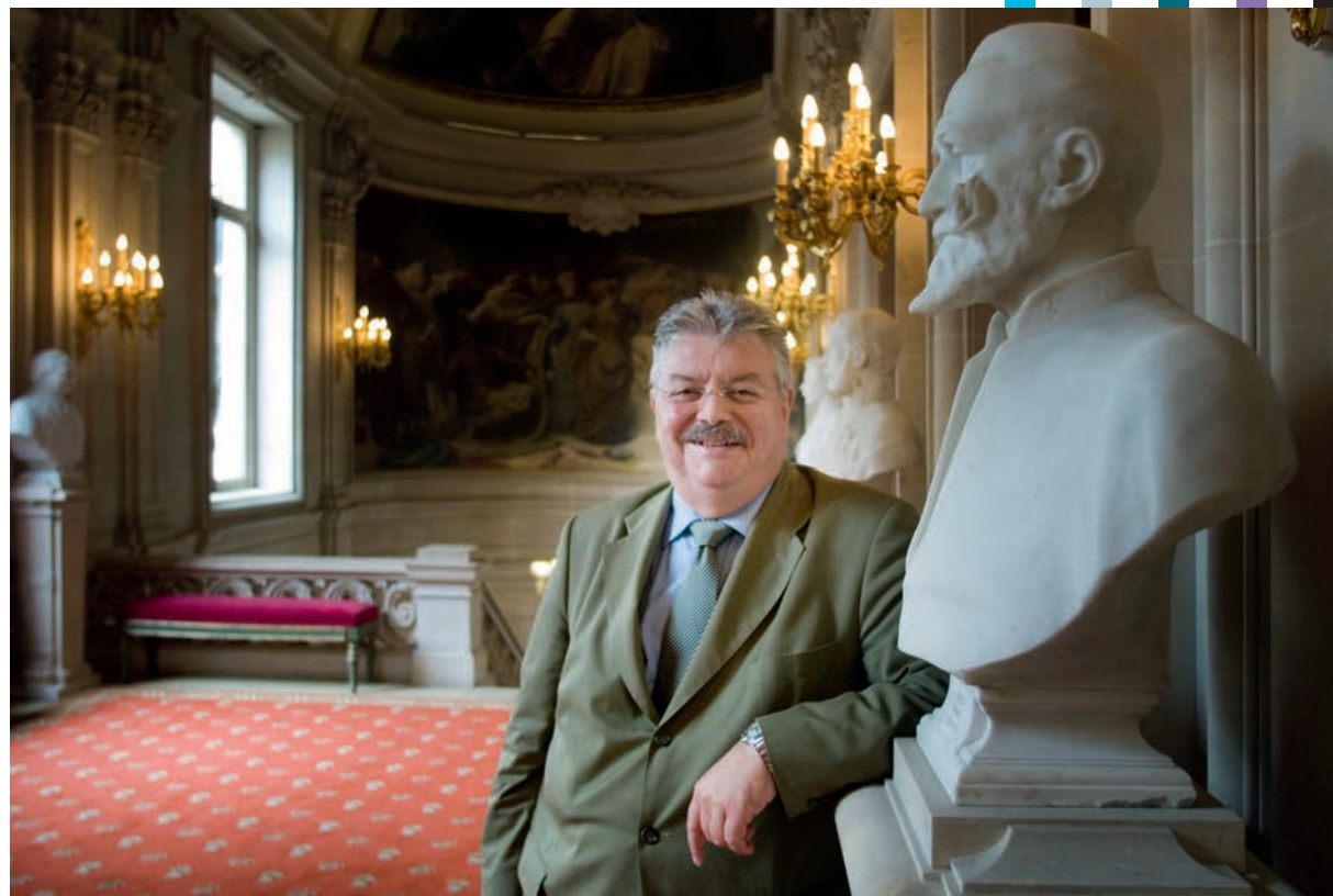
FREDDY_THIELEMANS