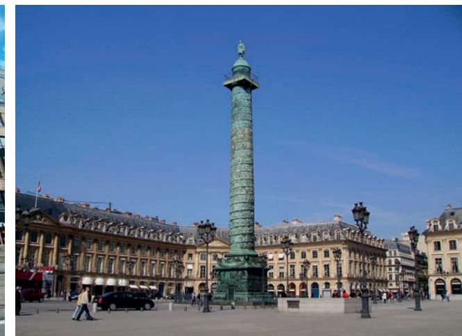
PLACE VENDÔME

aansluit bij de "gefaçadiseerde". Doch verhogen ze stiekem ook de gerecupereerde gevel met één verdieping. De nieuwe gevel blijft "hedendaags sober" maar voegt uiteindelijk weinig toe aan de plastische expressie en de diversiteit van stad en stadschap.