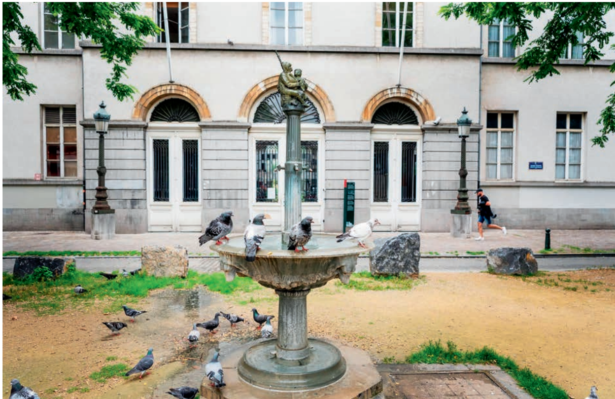
HET PACHECO INSTITUUT LIGT OP DE ROUTE VAN DE WANDELING 'IN DE LUWTE'

in het centrum van de stad blijven? Verken dan op 7 mei de rustige hoekjes van de boven- en benedenstad, tijdens de wandeling 'In de luwte' (zie foto). Raadpleeg brukselbinnenstebuiten.be voor het aanbod van tours voor individuen of groepen. Of ga alleen op pad met de Doe-het-zelfwandelingen van Bruksel en Muntpunt, te downloaden via utinbrussel.be/wandelingen .