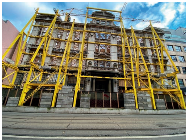
HOTEL ASTORIA IN STELLINGEN

vorm van façadisme, een praktijk die in de Europawijk opgang maakte.