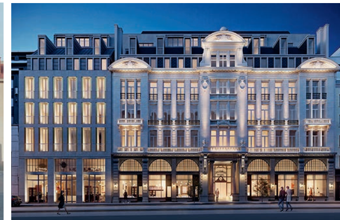
HOTEL ASTORIA PROJECT © ARCHITECTENBUREAU MA2

Maar terug naar Astoria. Corinthia heeft zich ook de twee aanpalende huisjes toegeëigend en zal op deze plaats het hotel uitbreiden. De architecten deden hun best om een nieuwe gevel te ontwerpen die qua verhoudingen en lijnen