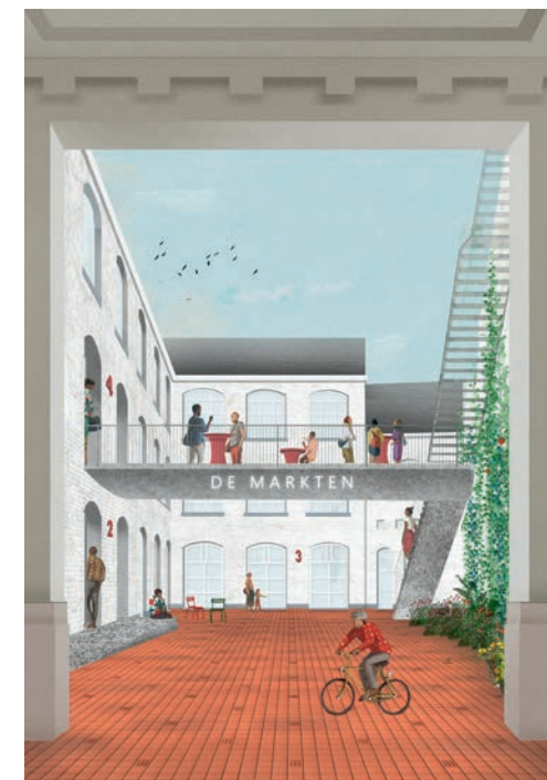
© TV JONA MOEREELS & BRAM DENKENS ARCHITECTEN

De verbouwingswerken gaan in de loop van september naar een vol-