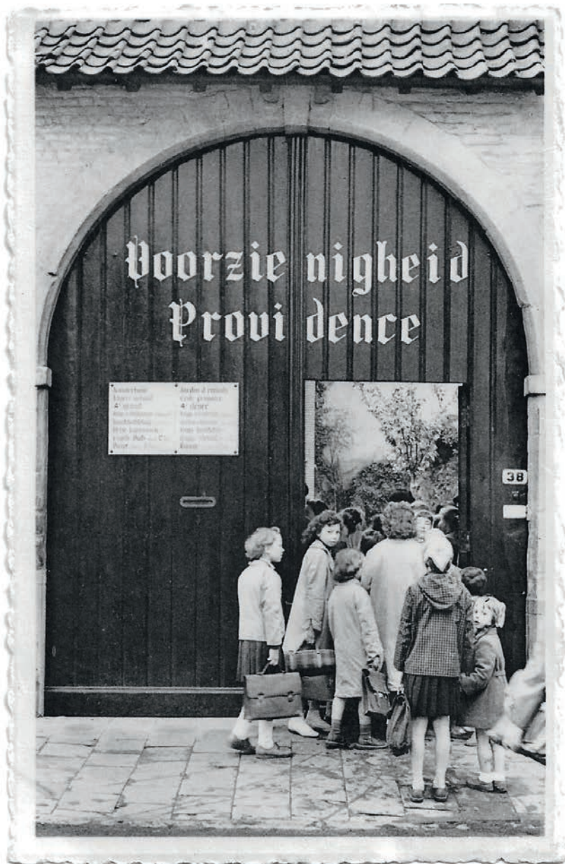
DE HOUTEN INGANGSPOORT VAN HET INSTITUUT VAN DE VOORZIENIGHEID IN SINT-LAMBRECHTS-WOLUWE IN DE JAREN ZESTIG