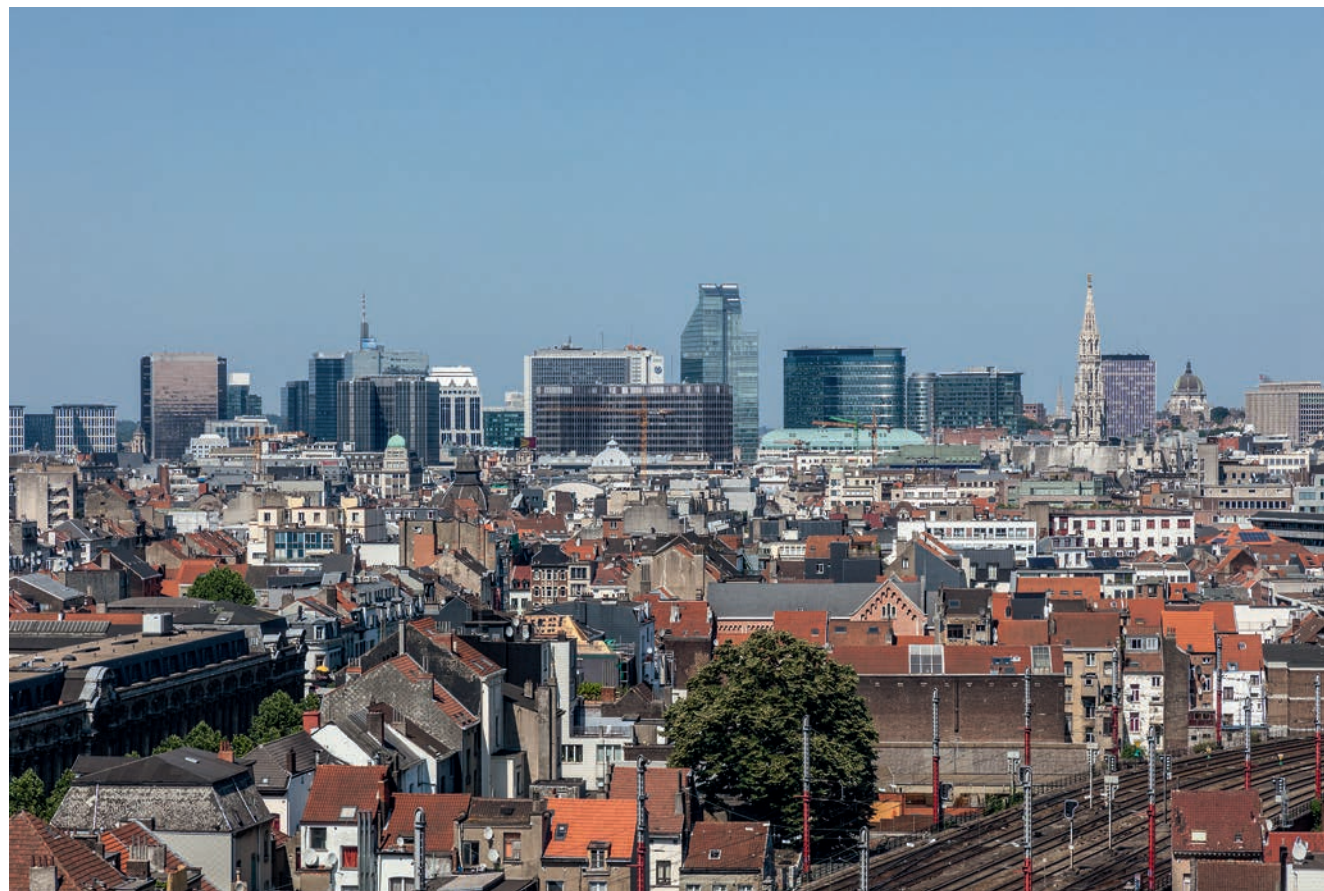
BRUSSELSE ARCHITECTUUR © HERMAN GENBRUGGE

gint bij respect voor de gebouwde omgeving, gebouwen op een intelligente manier integreren, bewaren van interessante straatzichten en doorkijken, bewaren en ontwikkelen van groen, de schaal van de omgeving respecteren (slecht voorbeeld BNP Paribas op de Warandeborg). De klimaatopwarming dwingt ons om rekening te houden met reliëf, met wind, met oververhitting. We moeten op zoek gaan naar koelte, natuurlijke aircopleinen creëren in dichtgeslibde woonwijken. We moeten anders omgaan met water, niet zoals op het Plassenplein (Overpoort) of de bassins van de Vismarkt, alhoewel deze nu toch wat meer recreatief gebruikt worden onder druk van de zon. In het Simone de Beauvoirpark (Fontainas) experimenteert men terug met regenwater opvangende grachten (wadi's). Ook aan de Ninoofsepoort maar daar wacht het grasveld nog op een echte parkaanleg en wat schaduw. Alleen met wadi's in enkele parken zullen we