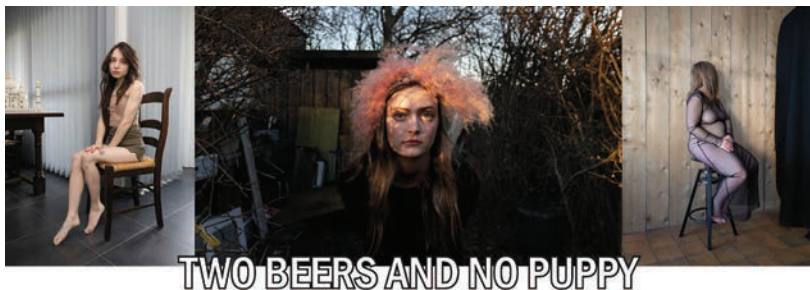
TWO BEERS AND NO PUPPY