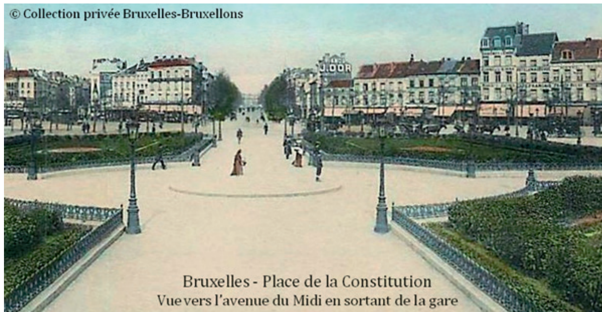
BRUXELLES PLACE DE LA CONSTITUTION

Aangezien het treinstation bij het Rouppeplein in een dichtbebouwd gebied lag en dus weinig uitbreidingsmogelijkheden had werd rond 1869 geopteerd om een nieuw Zuidstation te bouwen op de Zennebeemden in de vallei geprangd tussen Sint-Gillis en Anderlecht. Een station aanleggen op zo'n drassig moerasterrein was geen sinecure: de aanleg van een groot stationsvoorgeplein ging dan ook niet van een leien dakje. De Zenne stroomde er nog vrijelijk in open lucht. Ter hoogte van