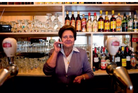
BAR LLANES

Wie Kolenmarkt zegt, zegt ook, Kerk van de Goede Bijstand, Sint-Jacobsroute naar Santiago de Compostela, "Au Soleil", ... en dit Spaanse beeld brengt ons vanzelf bij Bar Llanes. Llanes is het