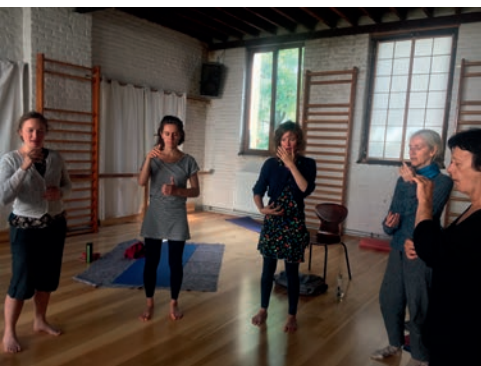
DE MYSTERIES VAN DE TAAL