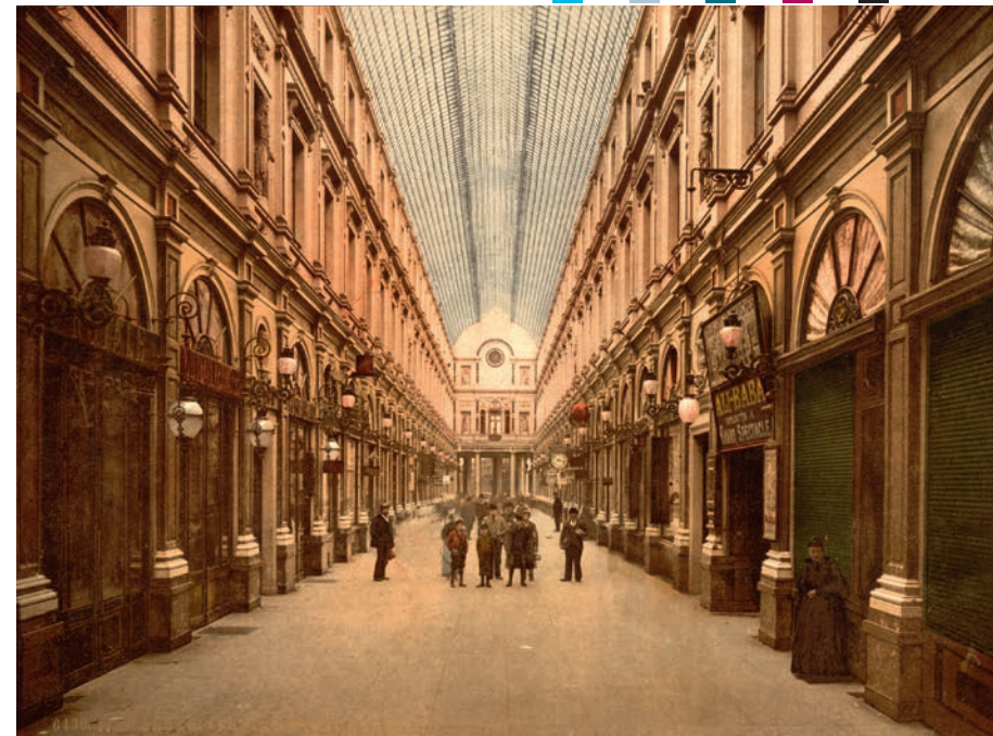
ST. HUBERTUS GALERIJ BRUSSEL

Wat er ook van zij: de onteigeningen zetten in het oude centrum zeker kwaad bloed. Het duurde uiteindelijk ook lang voor de 750 arbeiders met de werken van de eigenlijke passage konden beginnen, maar na de eerstesteenlegging in februari 1846 ging het razendsnel: na 13 maanden volgde de plechtige inhuldiging door Leopold I en zijn hele familie, een maand vroeger dan voorzien! En het banket dat ter gelegenheid van de opening werd