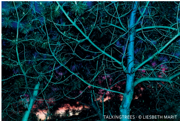
TALKING TREES